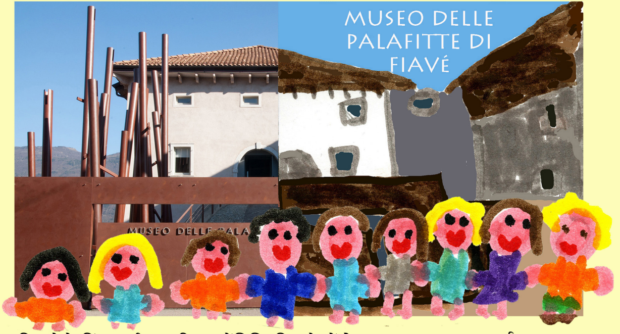
फिआवे के किंडरगार्टन "मारिया वलेंतिनि"-फिआवे (त्रेंतो)